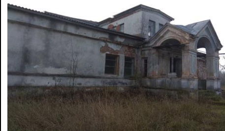
дом для престарелых и инвалидов

-442/С-8486 (Канализационная сеть) - 442/С-8483 (Водопроводная сеть) -442/С-8487 (Тепловая сеть) -442/С-8484 (Линия электропередачи подземная) Общая площадь (кв.м.): 18,4; 51,0; 12,0; 1178,4; 107,3; 211,6; 547,6; 509,3; 159,2; 97,9; 404,8; 76,8 Назначение: Здание неустановленного назначения Здание неустановленного назначения Здание неустановленного назначения Здание дома для престарелых и инвалидов Здание административно-хозяйственное Здание неустановленного назначения Здание специализированное для общественного питания Здание неустановленного назначения Здание неустановленного назначения Здание неустановленного назначения Здание специализированное автомобильного транспорта Здание специализированное здравоохранения и (или) предоставление социальных услуг Сооружение неустановленного назначения Сооружение неустановленного назначения Сооружение специализированное связи Сооружение специализированное коммунального хозяйства Сооружение специализированное водохозяйственного назначения Сооружение специализированное коммунального хозяйства Сооружение специализированное энергетики